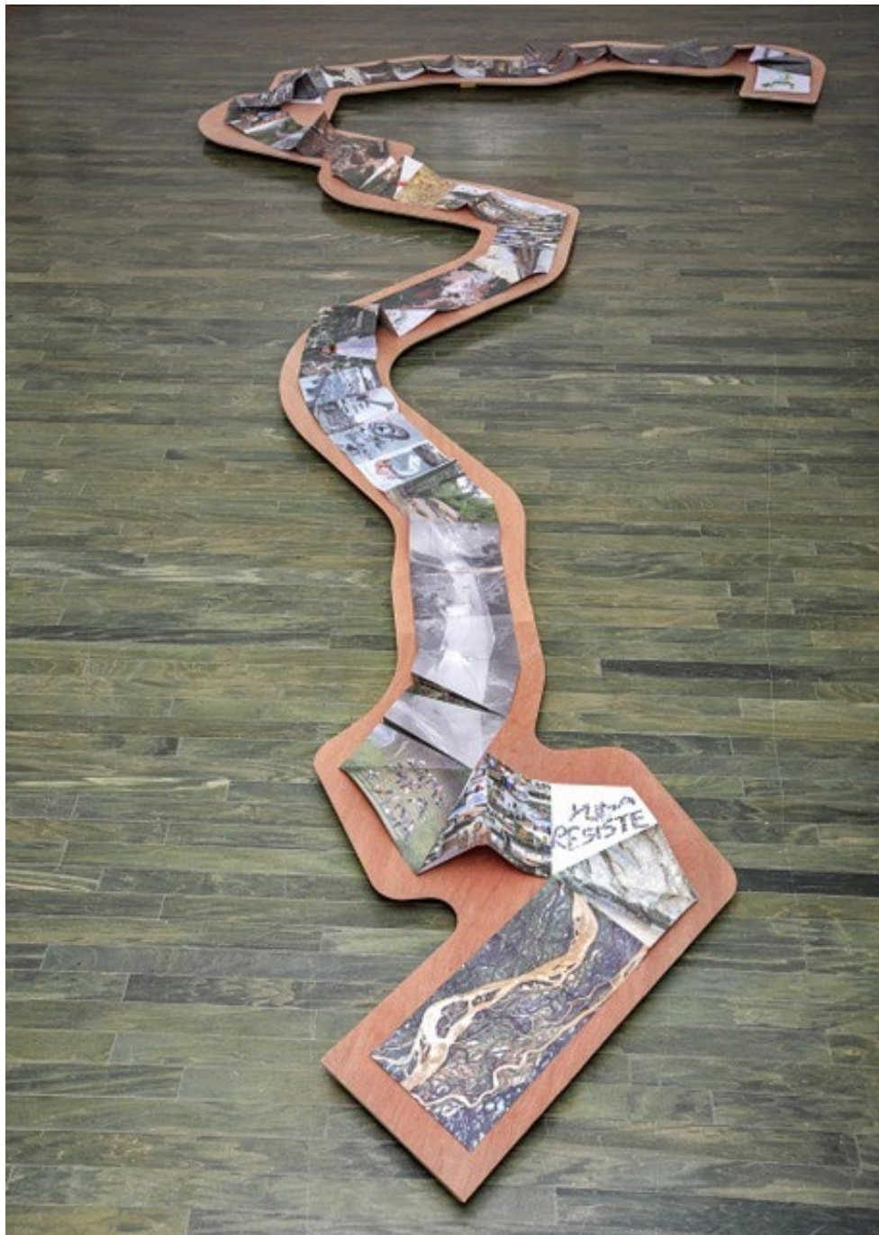
View of the exhibition, El momento del yagrumo . Museum of Contemporary Art of Puerto Rico, San Juan, 2021.